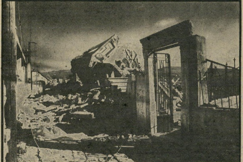
כמה עקוד להיראות רחוב אוסישקין

מישרדים מצריים חובלו בניו-יורק שבארצות-הברית, ומי לקח על עצמו את האחריות? הסניף העולמי של הליגה להגנה יהודית. מנהיגה של הליגה הזאת הוא, כידוע, הרב מאיר כהנא, מי שהיה מועמד תנועת "כך" בבחירות האחרונות לכנסת. מישרדי הליגה להגנה יהודית שוכנים ברחוב אוסישקין בירושלים. אני מקווה - מאוד מקווה - שמטוסי האויב לא יבואו לירושלים כדי להפציץ את מישרדי הליגה הזאת, מרכז המהבלים המקומי. רחוב אוסישקין בירושלים הוא רחוב יפה ונעים, שיוצא מרחוב בצלאל ויורד באוהליה פאסטורלית לעבר שכונת רחביה המעטירה. אם איני טועה יש ברחוב אוסישקין גם בית-ספר, אולי אפילו בית-כנסת, וגם בית-העם הירושלמי נמצא שם. יכאב לי הלב אם יהיו שם הפצצות רק משום שממשלת ישראל אינה אוסרת על השכנת מישרדי מהבלים באזור צפוף אוכלוסייה יהודית, ורק משום שהאוכלוסייה המקומית שדרה ברחוב אוסישקין לא עורכת הפגנות נגד שיכון המישרדים במקום ההוא. האם זה יכול להיות סימן לכך שהאוכלוסייה ברחוב אוסישקין שמכימה לשיכון המישרדים במקום? ואולי קרובי המהבלים וידידיהם, הם המתגוררים ברחוב אוסישקין? כשאני חושב איהו רמה של אי-דיוק יכולה להיות מושגת בהפצצה מן האוויר של מישרדי הליגה להגנה יהודית ברחוב אוסישקין, ממש כואב לי הלב.