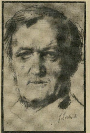
מלחין ואגנר מותר או אסור?

בזמן האחרון מתעצמת ההתקפה על התיזמורת הפילהרמונית ב' עניין ואגור. איומים מושמעים כל-