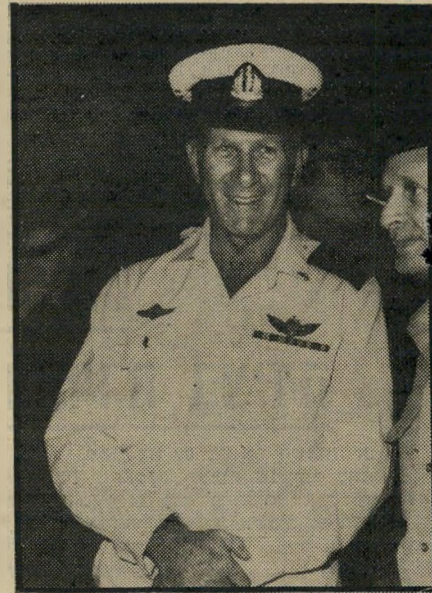
מפקד-חיל אלמוג ועדה פרטית

לא נאמרה אף מילה אחת על מה שקרה בספינה עד שעלתה על השירטון, ועל האפשרות שאנשי-הצוות במישמרת נרדמו. השלושה שהואשמו היו מפקד ה-