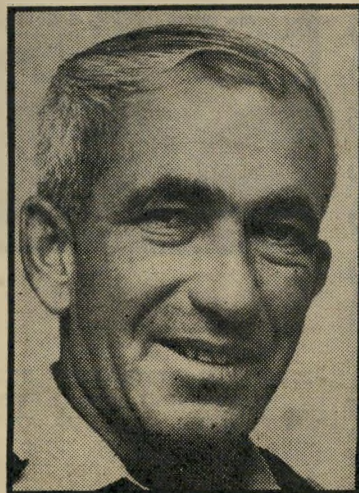
יועץ בוצר וגם לא תלם

אדם רצה למנות את מי שהיה מפקד חיל-הים, האלוף (מיל) בנימין תלם. קצין זה ידוע כאיש-ים מעולה וכאדם ישר, ללא משוא-פנים. אלמוג הודעק. הוא חשש שמא יהיה תלם בוועדה, ודרש למנות מישהו אחר במקומו. אדם נכנע ומינה מפקד אחר של חיל-הים לשעבר, האלוף (מיל) אב-