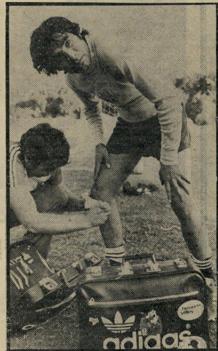
שוער מיוזרחי ומעסה רוזנצווייג אינטליגנטי ונערץ על הנערות