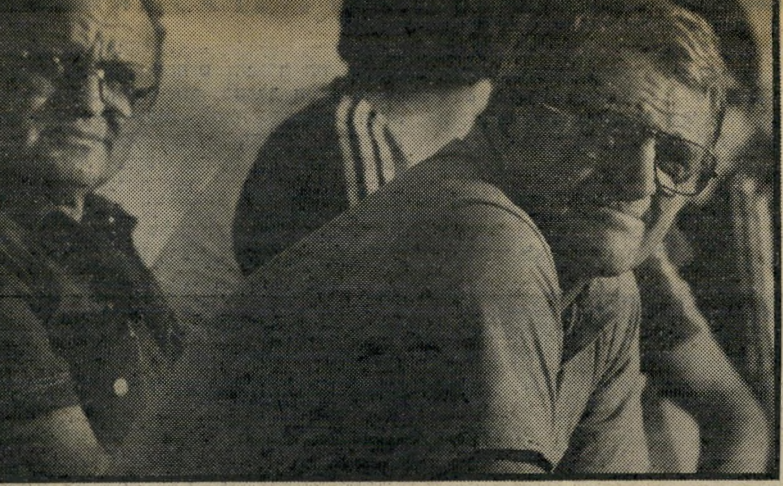
מאמן מנסל (משמאל): מנהלה-קבוצה כדורגל מייאשם בכישלונות?

עשה. אחרי שנתיים וחצי של עבודה יש לשקול אם לתת לו להמשיך.