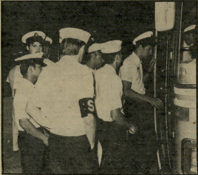
מרחי הצי השישי כתל-אכיב שיחוף-פעולה איסטרטגי בעולם התחתון

מחיר מיוחד של כ" ספר 33 שקל בכ"ר. שלח המהאה לת.ד. 6420 ת"א ותקבל את הספרים ישירות לביתך.