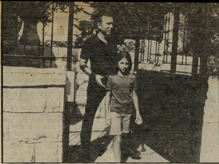
שדר לונדון (בבית דיין, אחרי מותו) כיפה לנגנים אוכלי-טריפה

עם הפעלת הטלוויזיה הישראלית בי- 1968, לא הבחין איש בעובדה כי שירות- הסרטים הפך מיותר. במשך יותר מ-12 שנה המשיך להפיק סרטי-תעמולה, שבי- חלקם הוקרנו במרכזים קהילתיים, ובי- חלקם נשלחו לחוצ-לארץ. מבחינת האי- כות לא הגיעו סרטים אלה לרמה הממור-