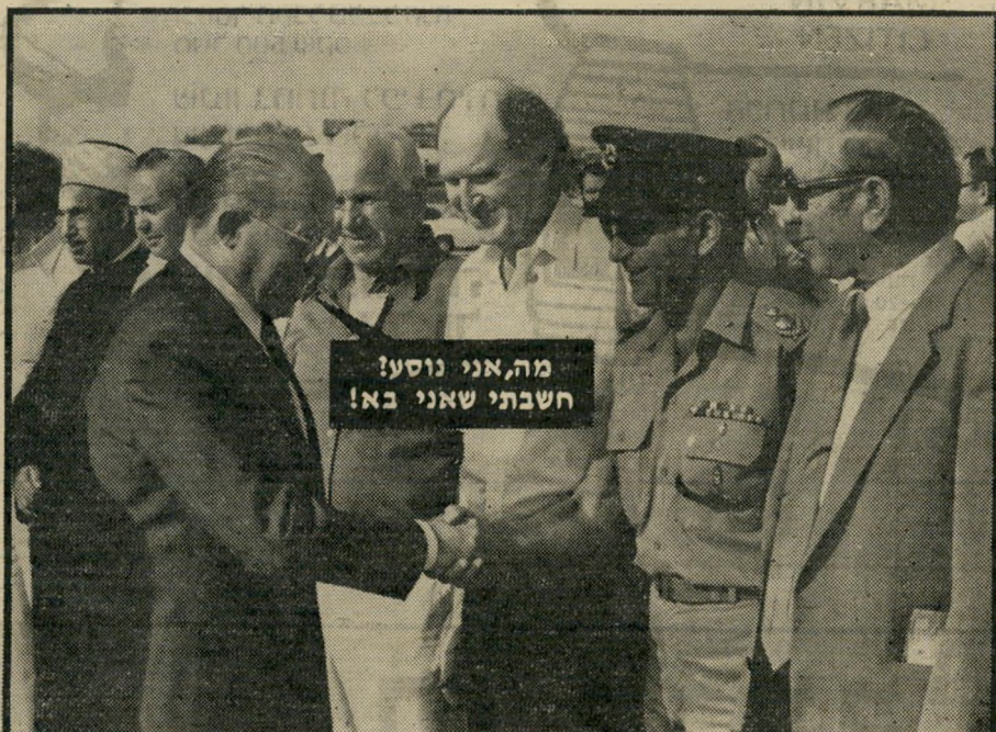
בגין בנמלי-התעופה לוד בורכו לארצות-הברית