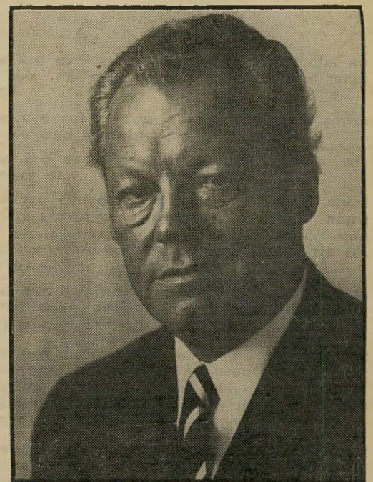
וילי בראנדט איש העשור?

השמרנים נוטים ליחס כמעט גזעני לעמי העולם השלישי ולשיתוף פעולה עם דרום-אפריקה. השקפה זו