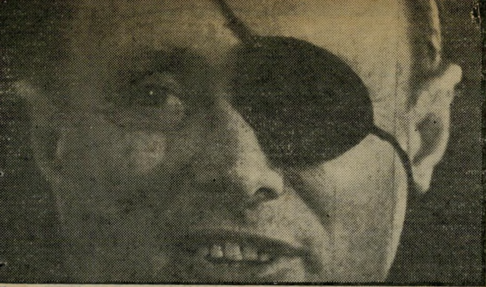
נמיר דיין הנוסטלגיה לא חוגגת