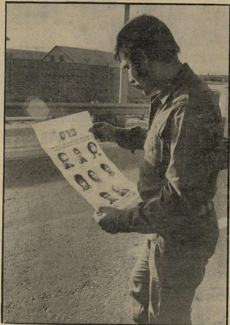
שוטר מישמר-הגבול וכרות הפרם „הרגשתי שהתאהבתי...“