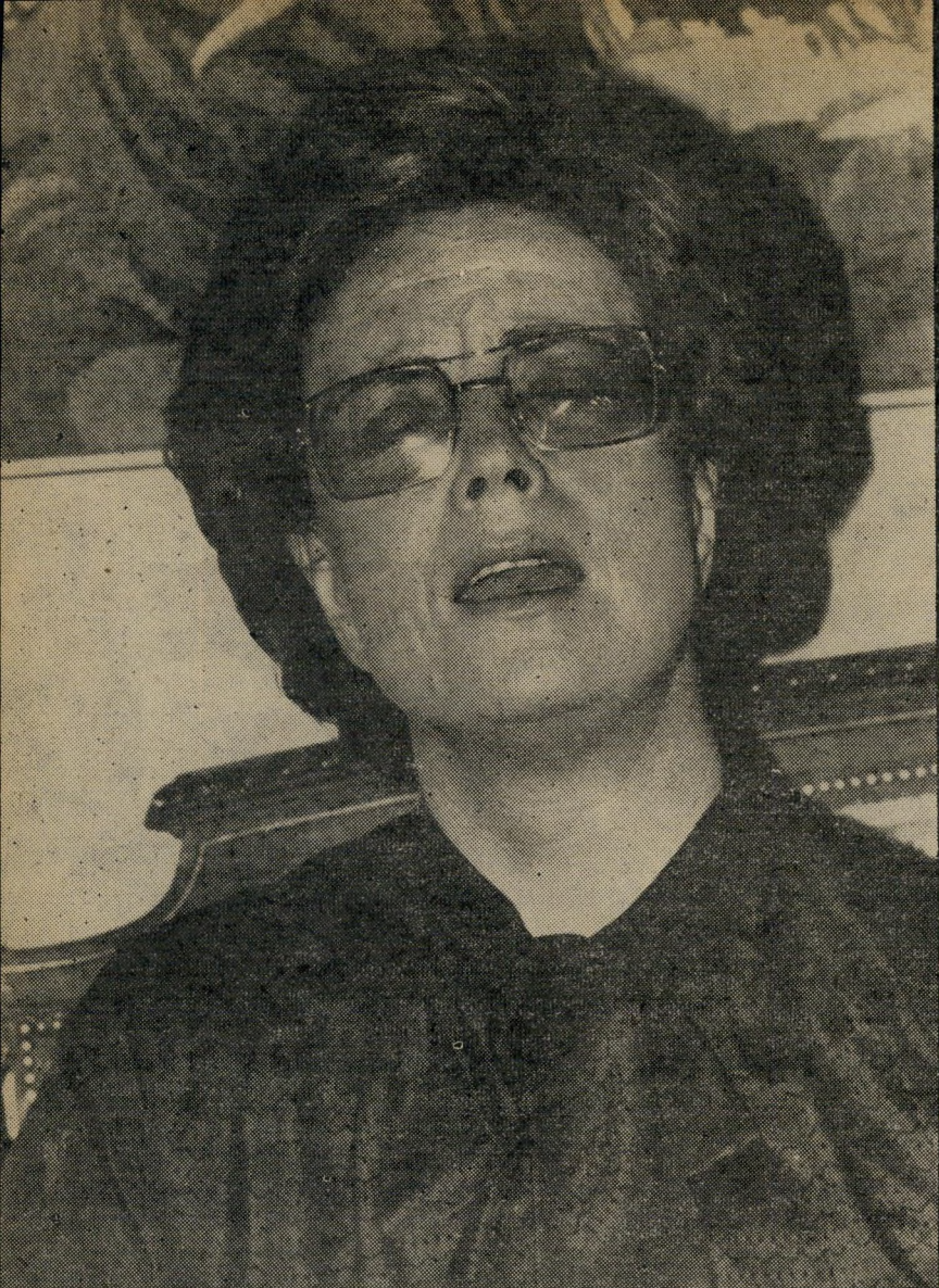
ג'יהאן אל-סאדאת כשיחה עם אכנרי „אשלח לך מקטרת של בעלי למזכרת”

שהייתי בת 15, ואהבתי אותו כך עד היום האחרון, אומרת ג'יהאן בשקט. בנסותה לתאר אותו, נפלטו מפיה כמה מילים יפהפיות: „הוא היה מוצק — מוצק כמו הר. ויחד עם זה הוא היה שקט — שקט כמו אגם.”