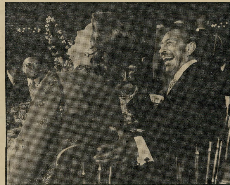
עם בעלה ובגיני במסיבה בבית הזבן אחרי השגום בגיני עדיף על פרס

כשסיפרה זאת השבוע, ידע כל העולם שהיא צדקה. אך איך ידעה ילדה בת 15 שהצעיר בן ה-30 הוא אדם מיוחד? איך מצאו זה את זה שני בני-אדם כה מירח חדים. שכל אחד מהם התפתח והפך אי-שיות נדירה? „אהבתי אותו מן היום הראשון, כי-