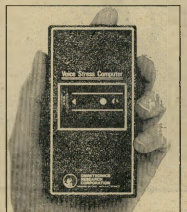
מחשב מתח-קול הנקרא שקרים אדם — שקר, ידוק — אמת

פשוט מאוד, כשנדלקת הנורית האדור מה. מחשב מתח-הקול אינו גלאי-שקר, טוענים היצרנים. כל מה שעושה מכשיר קשר זה (ראה צילום) הוא, מדידת נוכ-חות של רעדים זעירים בקולו של הנבדק. המחשב הזעיר שבמכשיר משווה בין