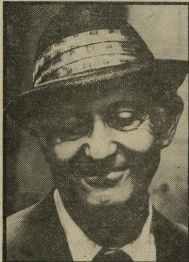
לי שטראסבורג זקנים