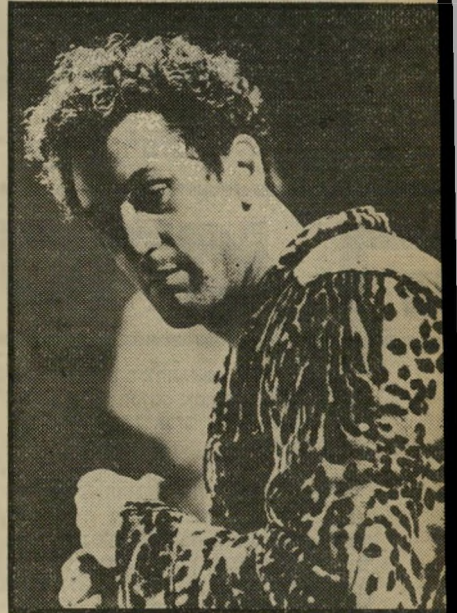
רוברט דה-נירו להחליף אישיות

אשר לחיק המישפחה, אמריקה החליטה לשוב ולהתעניין בו אחרי שנים ארוכות