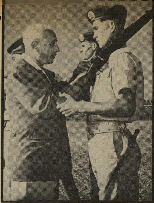
שר הביטחון לרון קצרה מדי

מישאלה זו קל להשמיעה וגם להסכים לה מאשר לממשה, בעיקר למי שעניו נשואות לכהונת רמות יותר. שתי סיבות עיקריות לדבר, האחת, שרוב התפקידים האחרים, המוסלמים על שר הביטחון — או שיש ביכולתו לכבוש לעצמו — מאפשרים לבנות מעמד ותדמית פוליטיים במישור הלאומי והבינלאומי — דבר שהוא קשה מאוד, או אף בלתי אפשרי, כאשר עוסקים בפרטים של מיבנה הצבא, אירגונו, כוונותו, אימוניו, ושאר עניינים