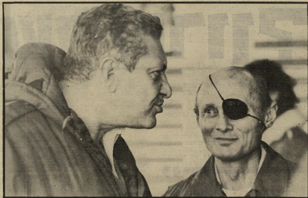
שרי הביטחון דיין ווייצמן

קשה לערער על הקביעה, שכיום צמרת צה"ל היא