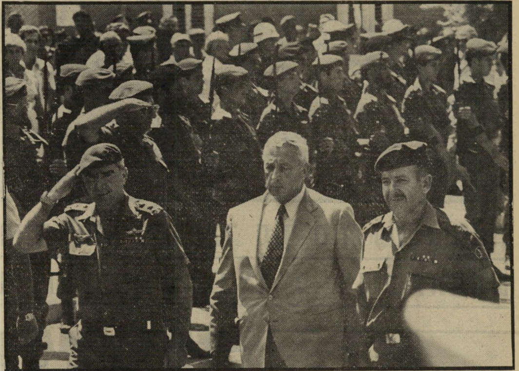
שר הביטחון והרמטכ"ל

מכיוון שאי אפשר לדרוש משר הביטחון, כי, בנסיונות הנתונים, לא יבצע את אותם תפקידים נוספים שכיום אין משהו אחר היכול או הנכון למלאם, הדרך הפתוחה בפני שרון היא אחת: את הטיפול השוטף והקבוע בכל התפקידים הללו עליו להעביר, במידה המירבית האפשרית, לפונקציונרים אחרים, שיפעלו כעושי דברו, לפי הוראותיו