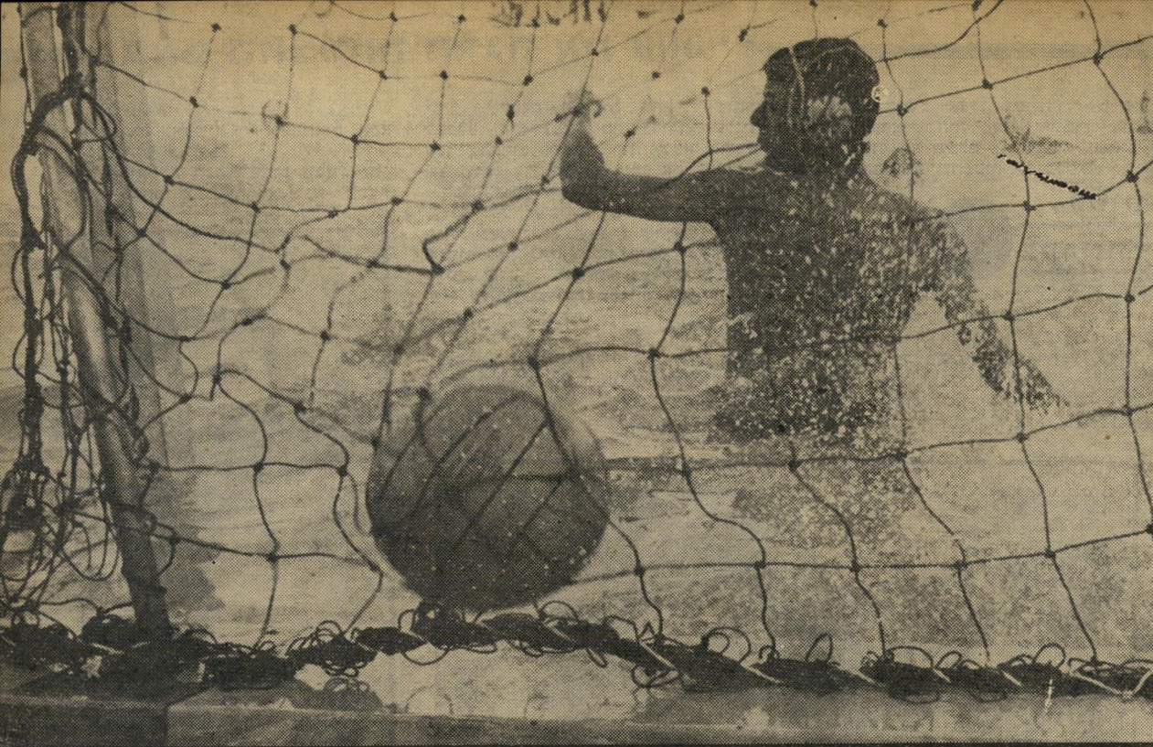
שוער פלג סופג שער אך השוער היריב 290 יותר