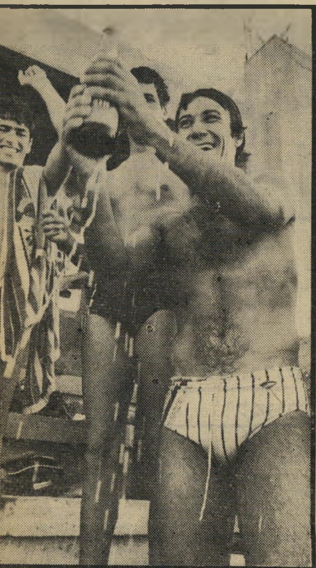
מנצח קרן שמפניה למנצחים

אסור לשחקני הכדורמים לעמוד על קרקעית הבריכה או להסתייע בה או בגוף שחקן אחר כדי להתקדם אל הכדור. במשך כל זמן המישחק חייבים השחקנים לשחות או להרים את גופם מעל לפני-המים.