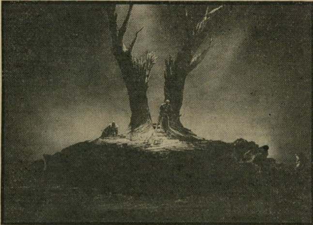
סצינה מתוך טריסטאן ואיזולדה אריות של אהובים

ר ינתיים, על הבימה, פוגע אחד מאנשי המלך בטרסטאן הבוגד, פוצע אותו בחיכוך והמע"