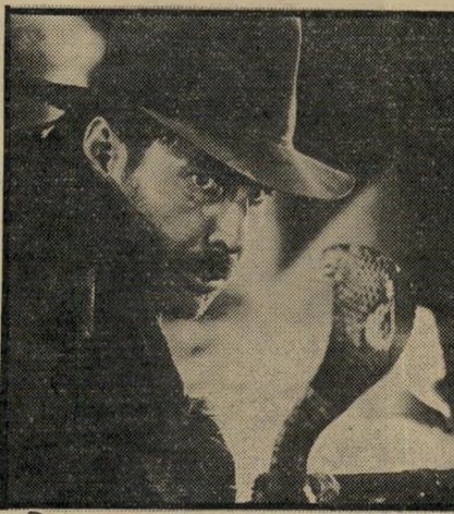
שיחה בין ארכיאולוג ונחש כמו פלאש גורדון וזרו

חזרה לסיפור. הביון האמריקאי, שהיה כבר אז קנאי ותתכן ודוחף אפו לכל פינה של העולם, אינו יכול, כמובן, לוותר על נשק אדיר כמו ארון הקודש, אפילו זה רק עניין של אמונה טפלה וכדי להכשיל את המזימה הנאצית, מוצאים את האתר כיאולוג הקשות, ההרפתקן והעקשן ביותר בתבל, ושולחים אותו לסחוב לגרמנים את משאת נפשם, מתחת לאף. העיניים רצות. עכשיו, כל מה שחסר הוא שהארביאולוג, הנושא את השם יוצא־