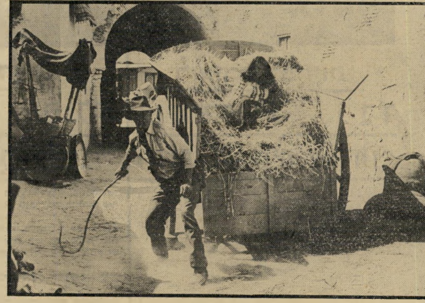
אינדיאנה ג'ונס מגן על חברתו מפני הנאצים במקום ברכת שלום סנוקרת אדירה

הדופן אינדיאנה ג'ונס, יאסוף את אהובתו לשעבר מבית־המרוח שנמצא בחור גידה שבהרי ההימלאיה, יסע עמה למצרים, יגייס לעזרתו כשרונות מקומיים אחדים ויגש למלאכה. אם נדמה שהוא אבוד כתריסר פעמים, וידידתו החברמנית הולכת לעולמה גם ושם, לא צריך לדאוג, ולמען האמת, גם אין זמן לדאוג. לפני שמעכלים את ה־טראגדיה, כבר קרו על המסך אלף דברים אחרים, העיניים רצות אחרי הגיבורים, שאינם נחים לרגע, ובסוף המירוץ אין שום ספק שהכל יבוא על מקומו בשלום. לא יתכן אחרת, בסרט שכזה.