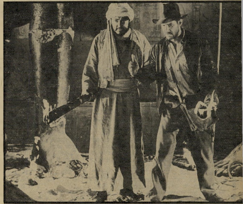
כניסה לקבר מצרי בחיפוש אחר ארון-הקודש שנגנב כאן לא מתעסקים בקטנות

בום-טראח. מזל, שזומן לזמן יש מי שנוכח ביעורו המקורי של כל דבר ודבר, ואם מי שנוכח ניהן גם בכישרון וגם בהבנת המדיום שבו הוא עוסק, יש לנו שוב סיכוי להינות משעתיים של כיף בי אולם הקולנוע. זה קורה, אבל זה נדיר. אולי משום כך, כאשר יצא הסרט שודדי התיבה ה"אבודה אל מסכי הקולנוע בארצות-הברית, הוא התקבל בגל התלהבות גועש כל כך. "שיבה למקורות!" זעקו המבקרים מלאי-