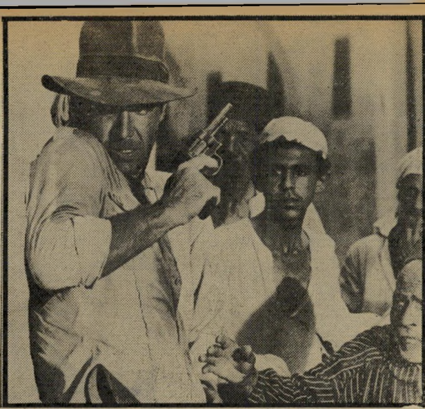
האריסון כאינדיאנה ג'ונס בפעולה כדור האבן המאיים לחחוק את מחללי הקבר בפרו שילוב של ארול פלין והאמפרי בוגארט

התפעלות, הרעיפו תישובות על ג'ורג' לוקאס, שהפיק את הסרט, ועל סטיבן שפילברג, הבמאי. ההתרגשות היתה כל כך גדולה, שחלק איבדו פשוט את השימוש בלשון, והתחילו להשתמש בביטויים כמו "בום", "טראח" ושאר ההברקות שמופיעות עתה בבאלונים של הסדרות המצויירות, כדי להסביר לצופה מה הוא עתיד למצוא בסרט הזה. ובאמת, אין תיאור מדוייק יותר, ל"שודדי התיבה האבודה מ"בום, טראח". זוהי