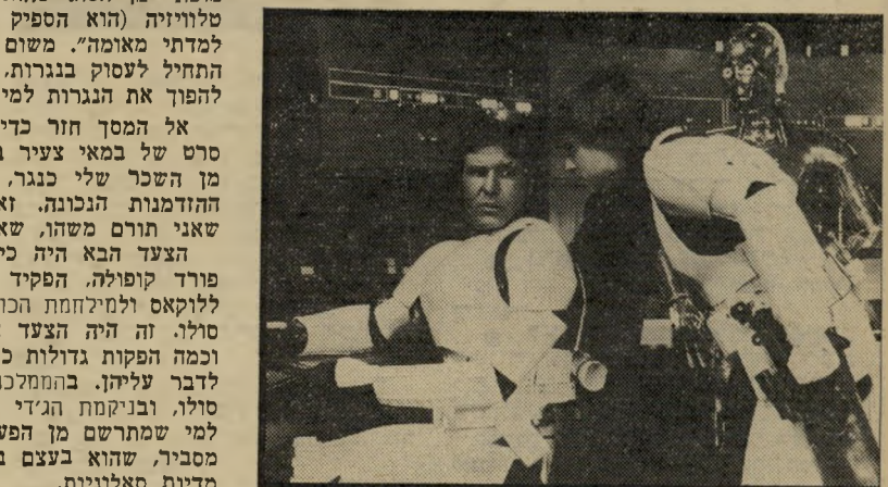
האריסון פורד בתפקיד טיים ב"מילחמת הכוכבים" זמנו לזמן צילומי פירסומת

ש-שעשרה שנים אחרי שהגיע להוליווד, מתחיל האריסון פורד להיות כוכב במלוא מובן המילה. ולמרבית הפליאה, זה לא קורה לו בהוליווד, אלא בסאן-פראנסיסקו, שם נמצא ג'ורג' לוקאס, האיש שנתן לו עד עכשיו את כל הזדמנויותיו הגדולות. "כשהגעתי לקאליפורניה", מספר פורד, "החתימו אותי על חוזה עם חברת קולומביה בשכר של 150 דולר לשבוע." במשך