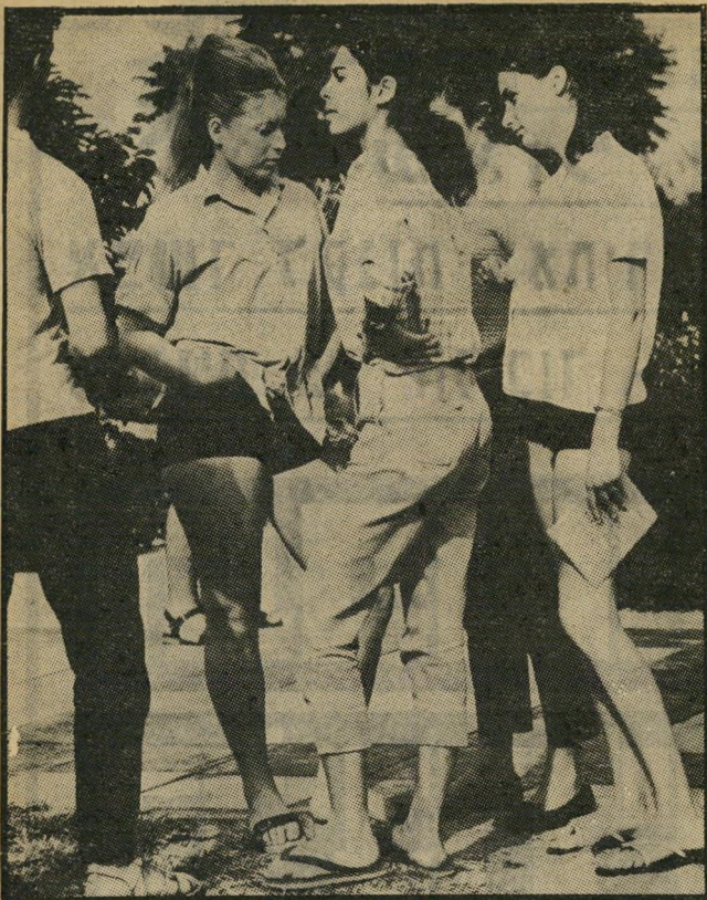
בני-קיבוץ * גזע עליון ומתנשא?

אין הם מבינים כי בעיני האיש בעיר-הפיתוח הסמוכה, הגדל ו החי ברמה הרבה יותר ירודה, הם נראים כקאפיטליסטים מתחסדים, כנצלנים חסרי-מצפון, כאנשים ש"זכו בכל-טוב בעזרת המדינה וה"תקציב הממלכתי, בעוד שהעולים החדשים ובניהם הוונחו וקופחו. עצם הטענה הזאת מדהימה את