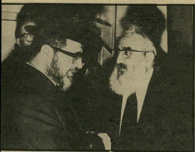
רבנים גורן ויוסף אינטגרציה בין-עדתית

על תופעת החזרה בתשובה בה בחוגי הבהמה ראשית, אני שמח בשבילם ש"מצאו לעצמם דרך מסוימת ואמונה