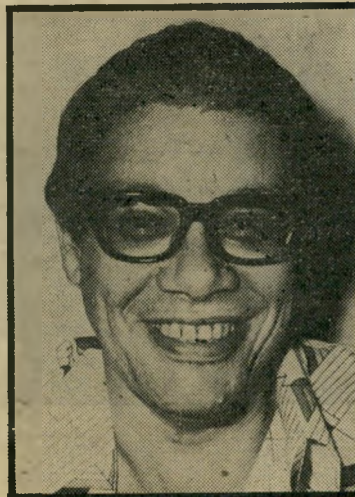
קורא ממים הגדה

בימים הנוראים מוטב לנו להתכונן - מתוך ראיית הנולד לקריאת ההגדה של חג הפסח ● מי שידוע לשאול, יבחינו לבטח בכוננתו המקורית של הי קדוש-ברוך-הוא, למנות את אריק שרון כשר-הביטחון: "אדיר במי לוכה, בחור כהלכה, גדודיו יאמי רו לו: / לך ולך, לך כי לך, לך אף לך, לך ה' המלוכה / כי לו נאה כי לו יאה..." ● אפילו בעליו ומנהלו של מיפעל שטיחי כרמל, לא קרא קריאת שמע של שחרית, עד ש דוד לוי הצטרף לממשלת הי שרים השוררת כה לכה: "גדול