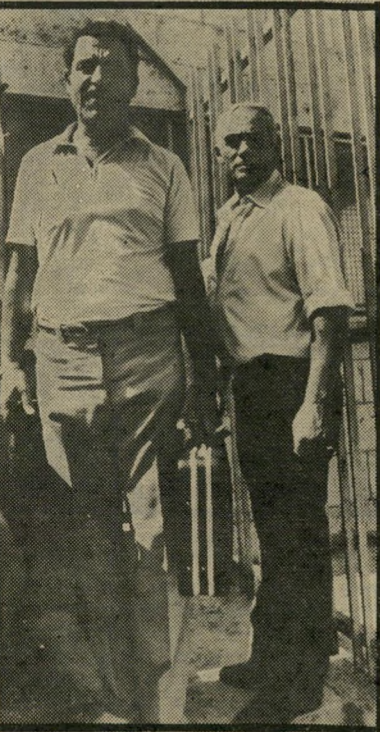
קצין איכו תלונה כנגד תלונה