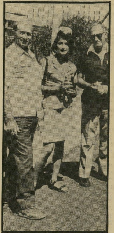
שוטרת עובד בתפקיד לא יימלטו מדו"ח