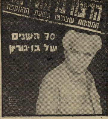
"העולם הזה" 1989 תאריך: 26.9.1956

גליון "העולם הזה" שראה אור השבוע לפני 25 שנה, הקדיש כתבת-שער ליום-הולדתו ה-70 של ראש-הממשלה דויד בן-גוריון, תחת הכותרת, "מפלתם עץ שדה בוקר". בכתבה זו ניתנה מערכת השבועון להעריך את מעמדו ההיסטורי של מנהיג זה, בקני מידה אובייקטיביים. תחת הכותרת, "רצח לאור המנורה" הביא עמוס קינן, את הראשונה בסדרת כתבותיו על נופי הארץ. כתבה עיתונאית אותנטית וחסרת-תקדים, הובאה בתצלומים ובמילים מבינים ארכיאולוגי אשר נערך בקיבוץ רמת-רחל שליד ירושלים, שהופסק במטח בן כמה דקות של ירי צלפי הליון הערבי. הכתבה הובאה תחת הכותרת, "7 הדקות של רמת רחל",