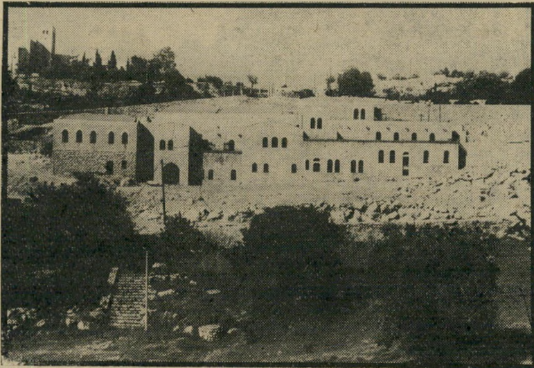
בניין הסינמטק החדש של ירושלים בגיא בן-יהונם מישכן קולנוע

כל-כך ברור. ומדוע מאפשרים למפקח החוקר בפרשה להרחיק לכת כל-כך - גם זה לא מובן, אלא אם כן יש לעניין סיבה פשוטה מאוד: חייבים להגיע בסוף הסט לעימות אישי בין המפקח (סקוט) ובין נציג הממון (בראנדו).