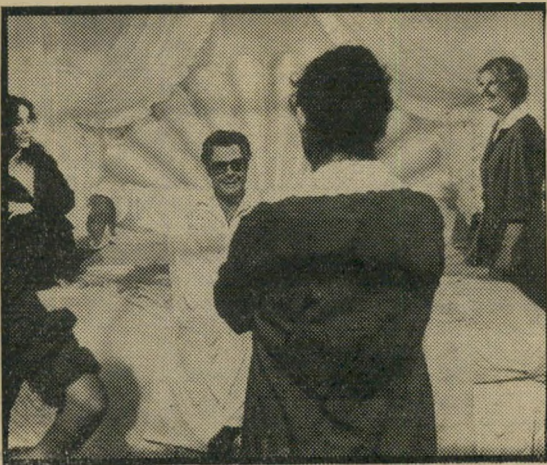
מאסטרויאני: האינטלקטואל לא השתחרר

מוע צריך היה להתין זמן רב כל-כך כדי להשתלט על נוסחה שהעולם כולו ידע על קיומה עוד בסוף מלחמת העולם השנייה (הגרמנים יצרו בזמן המלחמה דלק נוזלי מפחם) - זה לא כל-כך ברור. מה עניין קבוצות הטיור הגרמניות בתוך כל הפרשה הזאת - גם זה לא