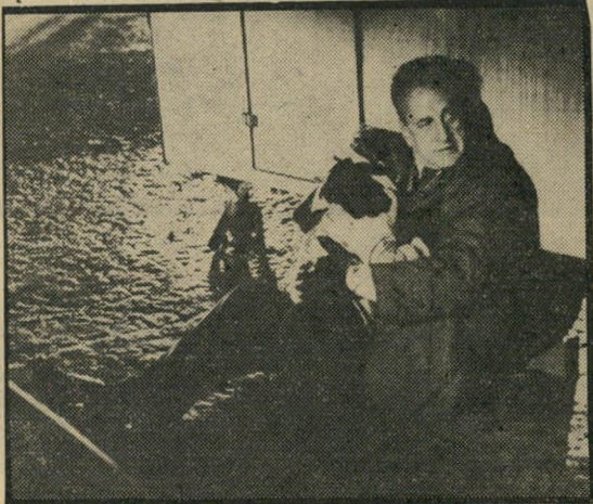
ג'ורג' סי. סקוט: הרבה סימני שאלה

טלקית, הוא כנוי לאבר מין גברי), המום מן הקולות שמגיעים לאוזניו מזירת ההתגוששות, סנאפורה הוא התיגלמות האינטלקטואל המבוגר, שלא השתחרר מהערכים עליהם גדל, והוא ניצב עתה מבלבל וחסר ישע בתוך עולם שערכיו השתנו בצורה קיצונית. שהוא אינו יודע מה טוב ומה רע, מה מותר להרגיש ומה אסור להרגיש, והיכן צריך לחוש אשמה.