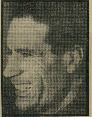
ראש לשועלים אל-קר'אפי בריכוכבא

"הוי ראש לשועלים ולא זנב לאריות!" אמר התלמוד הירושלמי מי איש השנה - הקולונל מר-עמר קר'אפי - בר כוכבא של