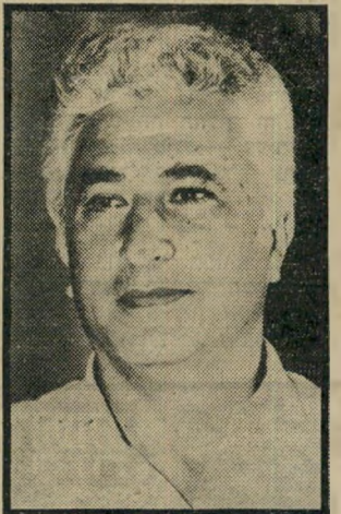
קונסנזוס-לאומי שפייזר עתיד להפתיע

השנה הוא עתיד להפתיע את כולנו - הוא ישאף לגבש קונ-סנזוס-לאומי לפי טעמים של הקי-