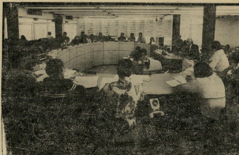
אולם המסחר בבורסה כתל-אביב מה יהיה בדצמבר, כשעשכשיו רק ספטמבר?