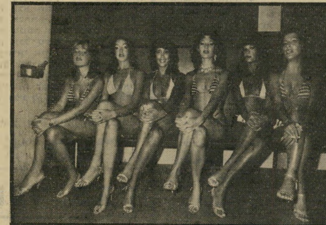
המועמדות ממתונות להחלטת הקהל עידוד ועזרה הדדית

תם ונשלם נשף בחירת מלכת זמרים. הזוכות המאושרות פרצו בדמעות אושר וחברותיהן התחבקו אתן מאחרי הקלעים. לכולן עדיין צפוי הטיוול הגדול לכרתים, רבות מהן שעדיין לא היו מעולם בחורל, התוודו כי עד לשניים בר-אוקטובר, מועד היציאה לחורל, ודאי לא תוכלנה להירדם.