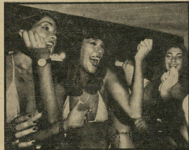
המנצחות מקבלות את הידיעה על זכייתן בסך-הכל 1990

ככל שגברו מחיאונו הכפיים הציעו הבנות מאחורי הקלעים ל-אילנה לקחת את עצמה קצת יותר ברצינות. ולהתחיל להכין את שיע-