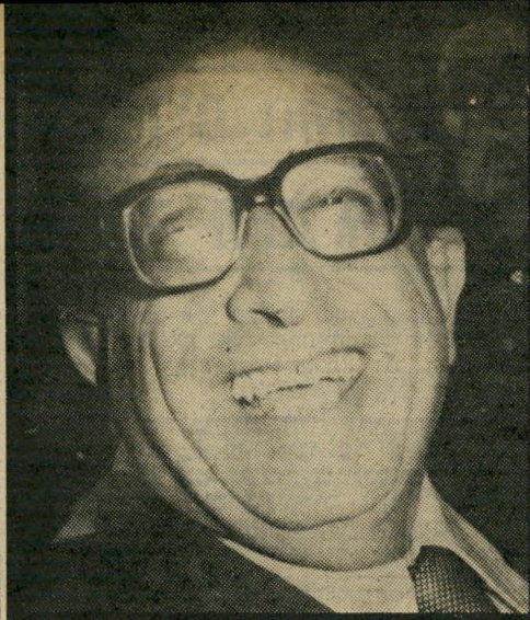
שר קורבן גורם זר