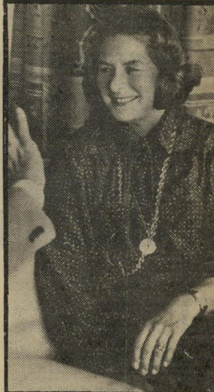
אינגריד ברגמן גולדה רמזה...

העיתונאים עדיין לא נמצאים במקום. המפיקים טרם החליטו כי-