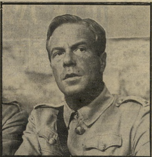
תומפסון בסרט "מישפטו של סגן מוראנט" ובתיאוביב לא כל אחד זוכה להזדקן לצד אינגריד ברגמן...