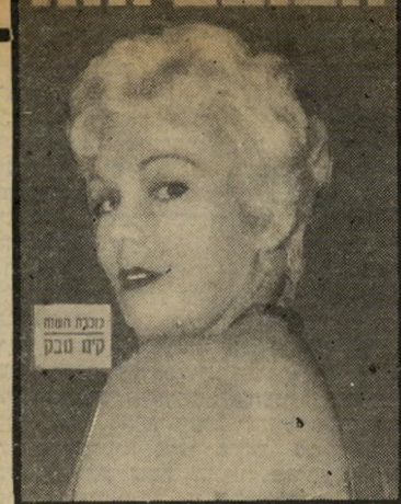
כוכבת העולם קים נובק