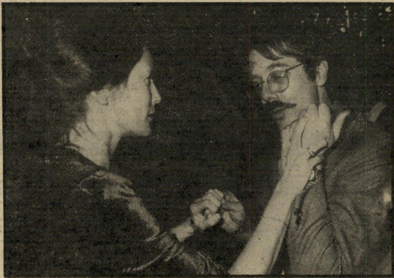
סגן-עורך, "מבט" גורן * שקול ותרבותי

לתום הקדנציה שלי בעריכת מבט לא אגיש אף מהדורת-חדשות אחת..."