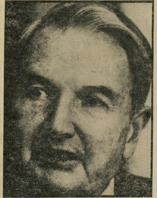
מיליארדר רוקפלר מכסיקו — יפאן חדשה

האמתלה הרישמית היתה העלאה צנועה של 2 דולר