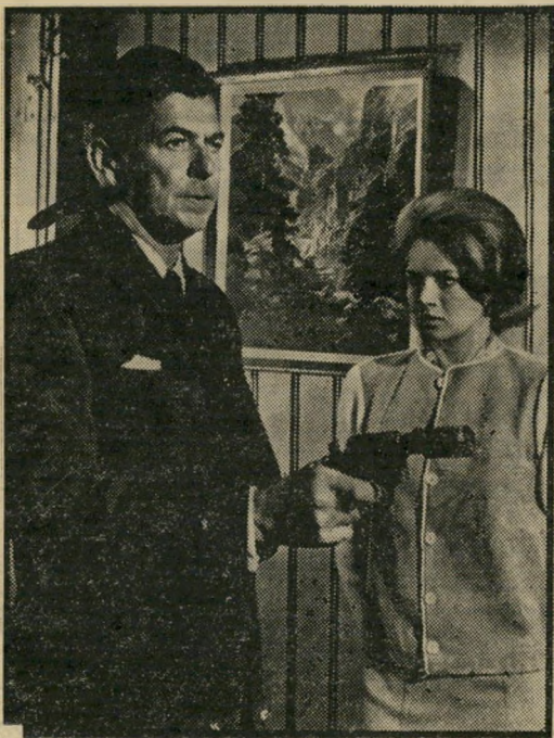
שחקן-קולנוע רגן בשירותו של ג'ו מקארתי

רגן התחיל את הקאריירה העסקנית שלו בהלשנה