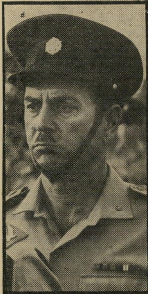
שוטר זינג שוטר השנה

בדרן השנה: דודו טופז. בדיחת השנה: יעקב מרידור.