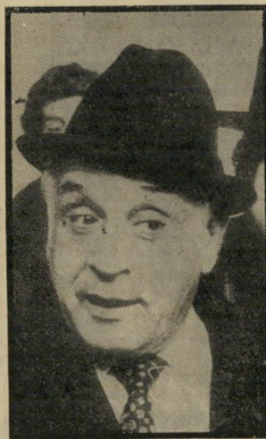
עזר וייצמן עזר השנה

...הגיע הזמן לחרוג מתחומי הר מדינה, ולהבין שלא כל מה שח"שוב בעולם קורה אצלנו. אין שום ספק שדווקא השנה קרו בעור לם המערבי דברים השמים בצל