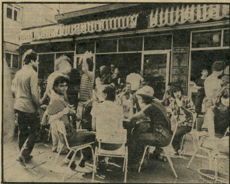
„דיצה“ בימיה הטובים, כיום ו' אחרי-הצהריים ואחרי-כך: נרקומנים ובלשים

„ברחתי מהמוות פעמיים, נאנחת האם שהיא ניצולת שואה, קשה לי לחשוב שעשיתי יהרוג אותי שופט אחד. אבל אני לא פוחדת מהמוות, אני פוחדת מהחיים.“