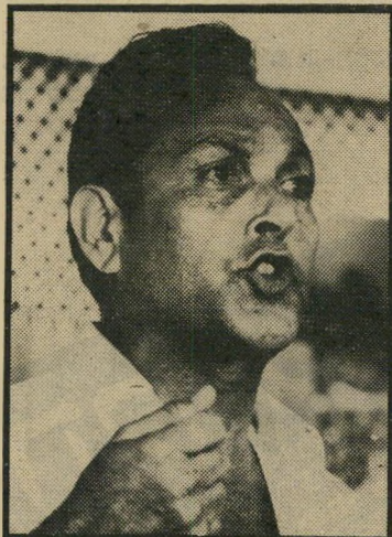
שר מודעי גינני בנידובי

אך שוב — הצדדים הכלכליים אינם החשובים ביותר כשמדובר בתעלת-הימים. הצדדים המדיניים חשובים הרבה יותר —