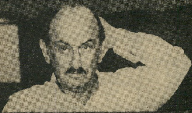
יו"ר שכטרמן (במישרדו בתנועת-החרות) לא פטרויטי