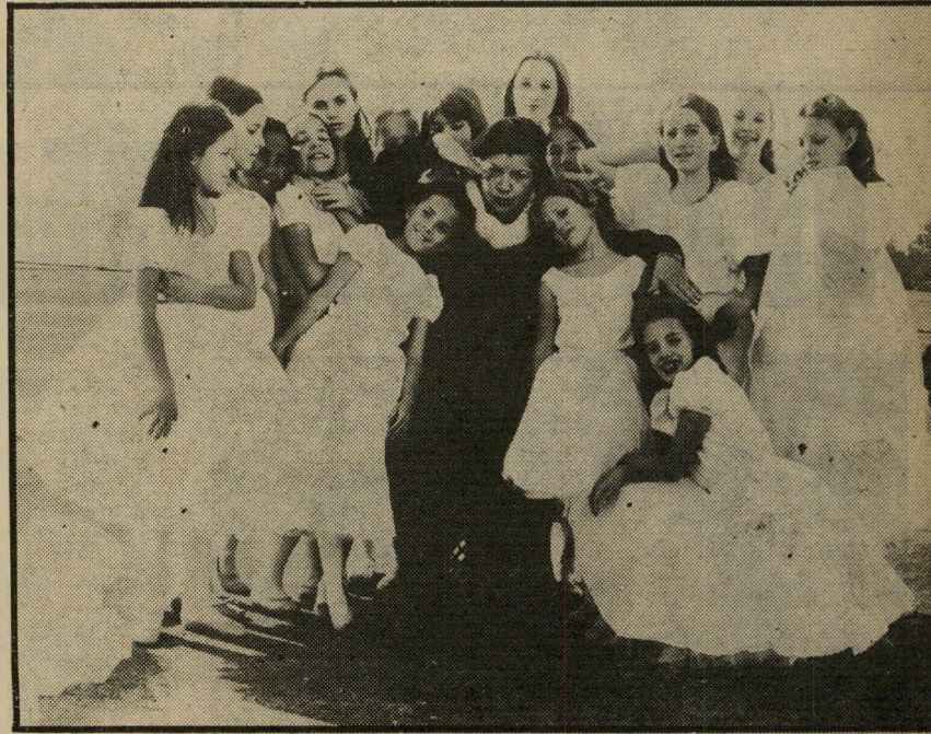
מורה למחוז וכוריאוגרפית ניוזינסקי עם תלמידותיה בפעולה מרוסיה לסן-פרנציסקו

קירה נולדה בוניה, אביה ואסלאב ניוזינסקי ואמה, רומולה, לא הטילו שום ספק ביחס לעתידה. בגיל 17 זכתה ל-ביקורות נלהבות כשהופיעה כהלנה היפה