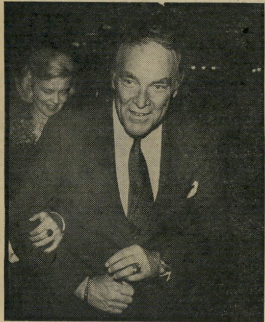
שר-חוזק אלכסנדר היינ

אין המדובר בתופעה בודדת, חריגה. המישטר הסטאליניסטי של גוסטאב הוסאק אחוז חרדה וחלחלה נוכח התפשטות התנועות הדמוקראטיות בפולין, והליברליזציה הפושטת בהונגריה. הוא השליט בארצו טירור המזכיר את שנות החמישים. צ'כוסלובקיה הפכה למדינה הקשוחה