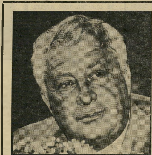
שר-הביטחון אריאל שרון מי יתן את ההוראה?

ממשלת ניקאראגואה אינה חוששת במיוחד מעימות צבאי קונבנציונאלי. 40 אלף החיילים ואנשי המיליציה האזרחית יוכלו להרוץ, בקלות יחסית, תוקפנות מעבר לגבול. אבל המצור הכלכלי מתחיל לתת את אותותיו. המעמד הבינוני רוטן על המיסים הכבדים, שנודעו לממן את הרפורמות החברתיות. מנהיג האופוזיציה, אלפונסו רובלו, המנהל רמת-חיים גבוהה ביותר אך מגדיר עצמו כ"מהפכן אמיתי", אמר לעיתונאי האמריקאי פיטר צ'אפמן, ש"הממשלה סטתה מדרך הפלוראליזם. הכלכלה המעורבת ומדיניות-חוזק ניוטרליסטית". אבל רוב העם בניקאראגואה ממשיך לתמוך בסאנדיניסטים. כעיקר זכתה לאהדה התוכנית לביעור הבערות. מכלל 2.5 מיליון תושבי ניקאראגואה נכללים עתה יותר ממיליון כתוכניות-לימודים מגוונות. רוב המורים הם מתנדבים, ולמעשה נערך גיוס כללי של האינטליגנציה כדי לחסל כליל את האנאלפבתיות בניקאראגואה.