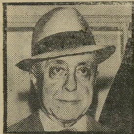
עוזר ויזנמן איראני

הוא קרא על המושבה האחות כפר-תבור, ומגיב ("העולם הזה" 2292) כצופה מן הצד המבין משהו ב"שלטון המקומי, הנני מבקש לקבוע, כשפר-תבור כיום הגה הרבה מעל