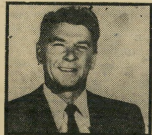
נשיא רגן החרפה