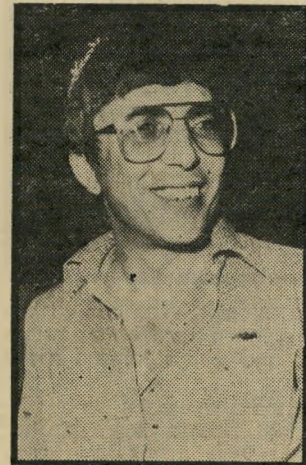
שר אברו-חצירא סמל לעדה

... זהו האיש שהעלה את הר-ליכוד לשלטון בישראל, כאשר חילק סוכריות בשפע, סוכריות גשמיות וסוכריות מילוליות. זה האיש שסיפק לעם היושב בציון