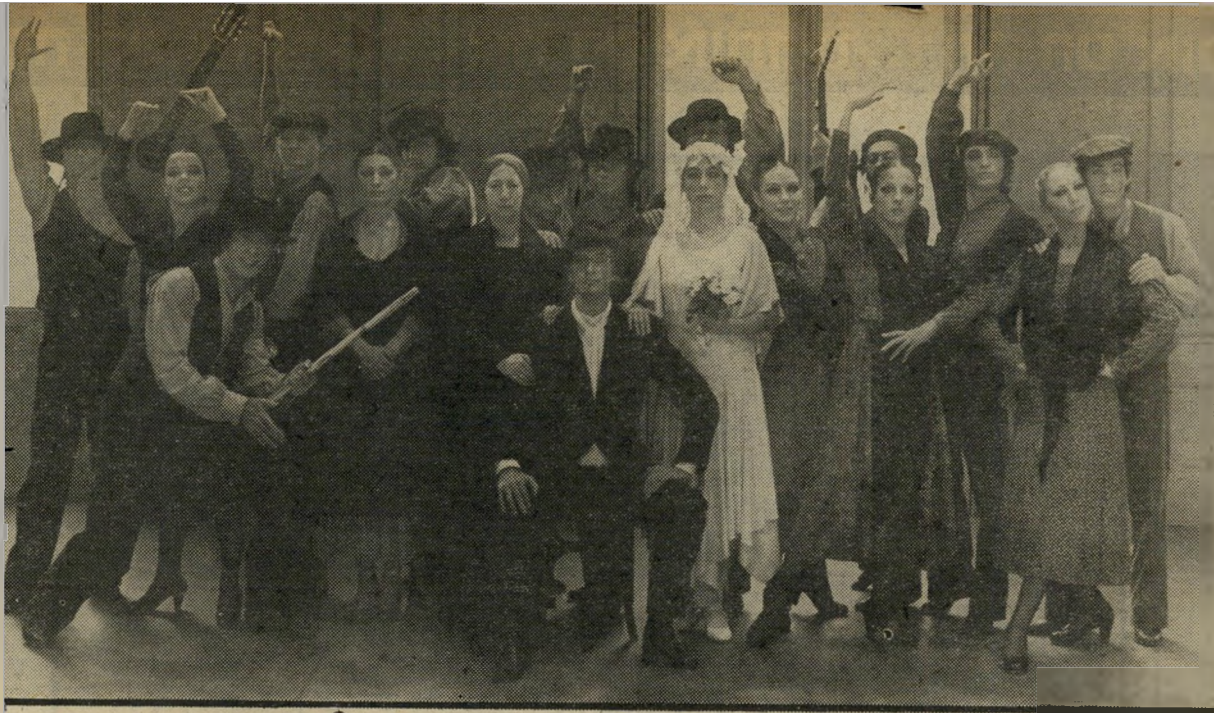
צילום מישפחתי של "חתונת הדמים", סרטו של קארלוס סאורה הרגע בו קפאה המצלמה