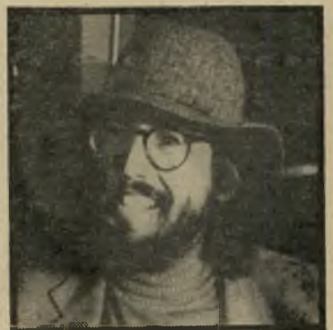
במאי ג'ון לאנדיס אנארכיסט

אותו סרט אימים שהבטיח, ושמו אדם-זאב אמריקאי בלונדון. מכמה רמזים שהוצגו לפני מפיצי הסרטים בפסטיבל קאן, כדי לגרות את תיאובנם, אפשר להבין רק את שלד העלילה: שני צעירים אמריקאים המטיילים בצפון אנגליה שומעים יללה מקפיאת דם בלב שדה פתוח. שלושה