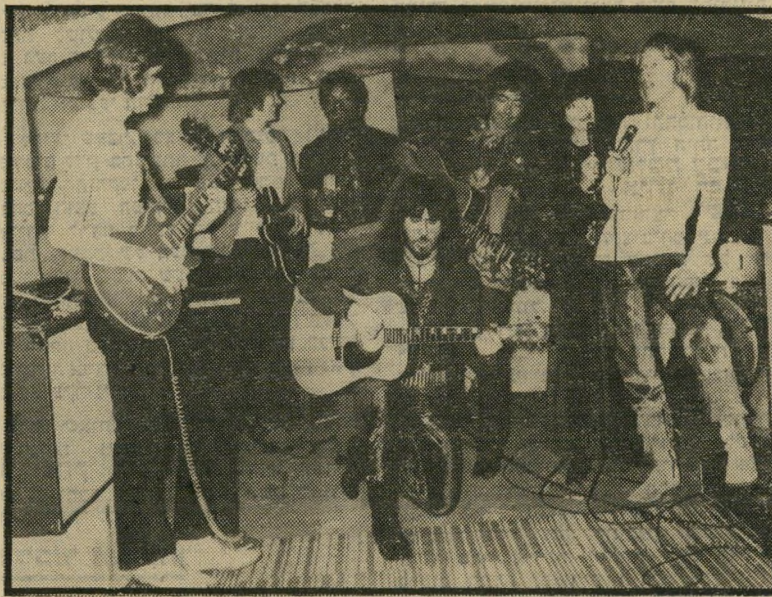
אבי כמפיק פופ

מי הציג אותך? פעם חברה שלי, ופעם אנשים שבאו אלי הביתה. איזה זמר מתחיל והחברה שלו.