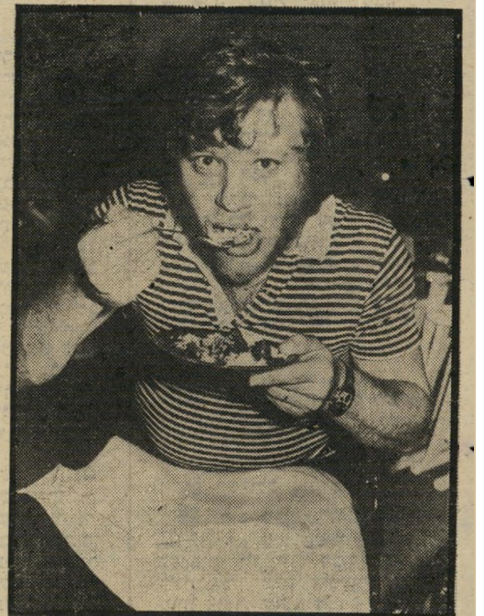
בתיאבון לצ'רצ'יל שנהנה מן האוכל הרב שהוגש במסיבה. כדי שלא להתלכלך הוא פרש מפית על ברכיו.