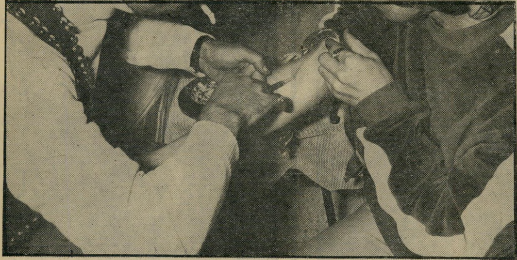
צרכן הרואין בפעולה סט מהדוד סט

ואומנם, נראה כאילו התהה לסובייטים עדנה חדשה במיזרח התיכון, ולא-דווקא בשל הברית הלוזית-אתרית