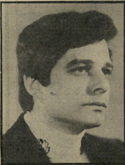
מנכ"ל פרבר דיווח מהמערכת

מיד אחרי תחילת שנת הלימודים ב-1971 הופיעה בשבועון הסטודנטים של חיפה,