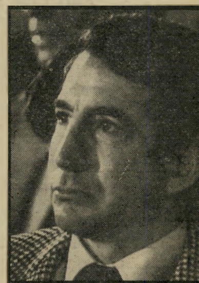
מיליונר אלבין שותפות בפיריון ובקיטריה

פורט מורטס, כתבת-ענק ובה גילויים על איסדרים במועדון הסטודנטים. דווח שם על כניסת מאות אורחים ללא תעודות סטודנט, ועל כניסת עשרות אנשים חניפי אייזנברג, רובם „אורחים“ של חברי ועד אגודת הסטודנטים. התברר שמפעיל הרור לטה לא שילם לאגודת הסטודנטים פרוטה עבור הזיכיון, ומפעילי שולחנות ההימורים הקטנים שילמו סכומים מגוחכים תמורת זיכיונם.