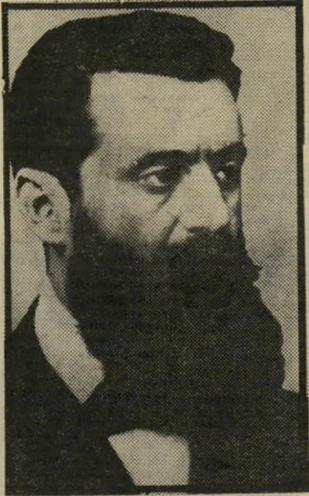
חזוה הרצל הזהר ושוב

והרצל, בתחושה עזה שלא ימצא לה אה ורע בהיסטוריה שלנו, עמוק עמוק בלבבו, חש את מעמקי אומללותו ומרחבי אי-גבול של מצוקתו של העם, ובכאב פנימי