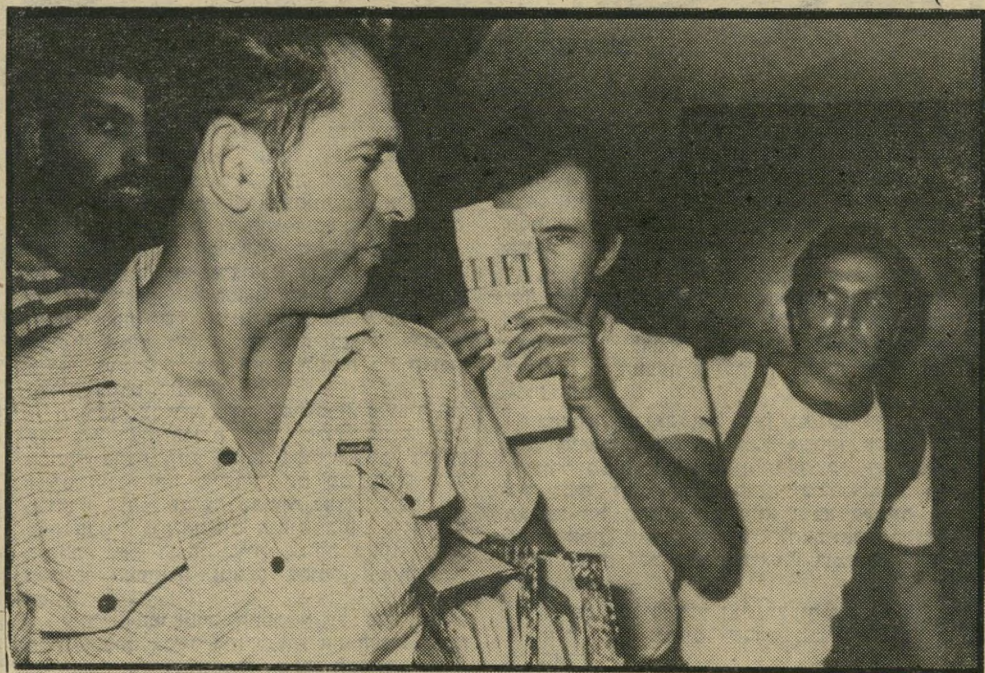
גרנות מכסה את פניו ביציאה מאולם המעצרים - מעשים מגונים בקטינות