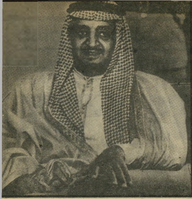
האמיר פאהד מימה ושמה שלום

ממשלה ישראלית גבוהה על כן, מברכת על ההצעה הסעודית. מרימה אותה על נס כביני להתגברות התבונה במחנה הע'בי, ומזמינה את סעודיה ובעלת בריתה — וביכללם אש"ף — ל'תיחת משא-ומתן גלוי או חש'כי סעודיה אינה מדינה שול ומרוחקת. מאז קמפ-דייוויד ו'רוש מצריים מן העולם הער'סעודיה היא המרכז המוכר ל'האומה הערבית. מערכת-יחס מסועפת, הדוקה אך בלתי-ירי מית, יצרה מערך ערבי שבו שו'פנים, לצד סעודיה, כל מדינות מ'פירץ הפרסי, עיראק, ירדן, מ'רוקו והנהגת אש"ף (ראה עמ'6). ואכן, דובר בכיר מאוד ל'אש"ף, אבו-ג'יהאד, הדרו לבו על ההצעה הסעודית ולהבטיח א'המיכת אש"ף בה.