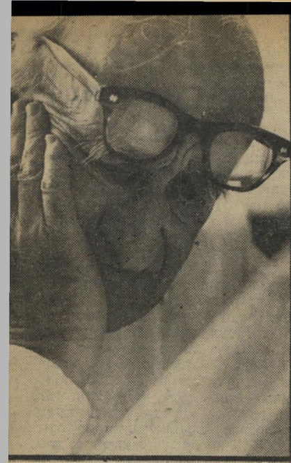
ליבוניק חוקר המצאת מרדור — רמאות וגניבת-דעת

טוב, רק"ח היא סוכנות קומוניסטית. מה שהם אומרים בעניין השטחים זה נכון. אך אני יודע מה יגידו מחר, אם יתקבל צו ממוסקבה להגיד התיסך מזה.