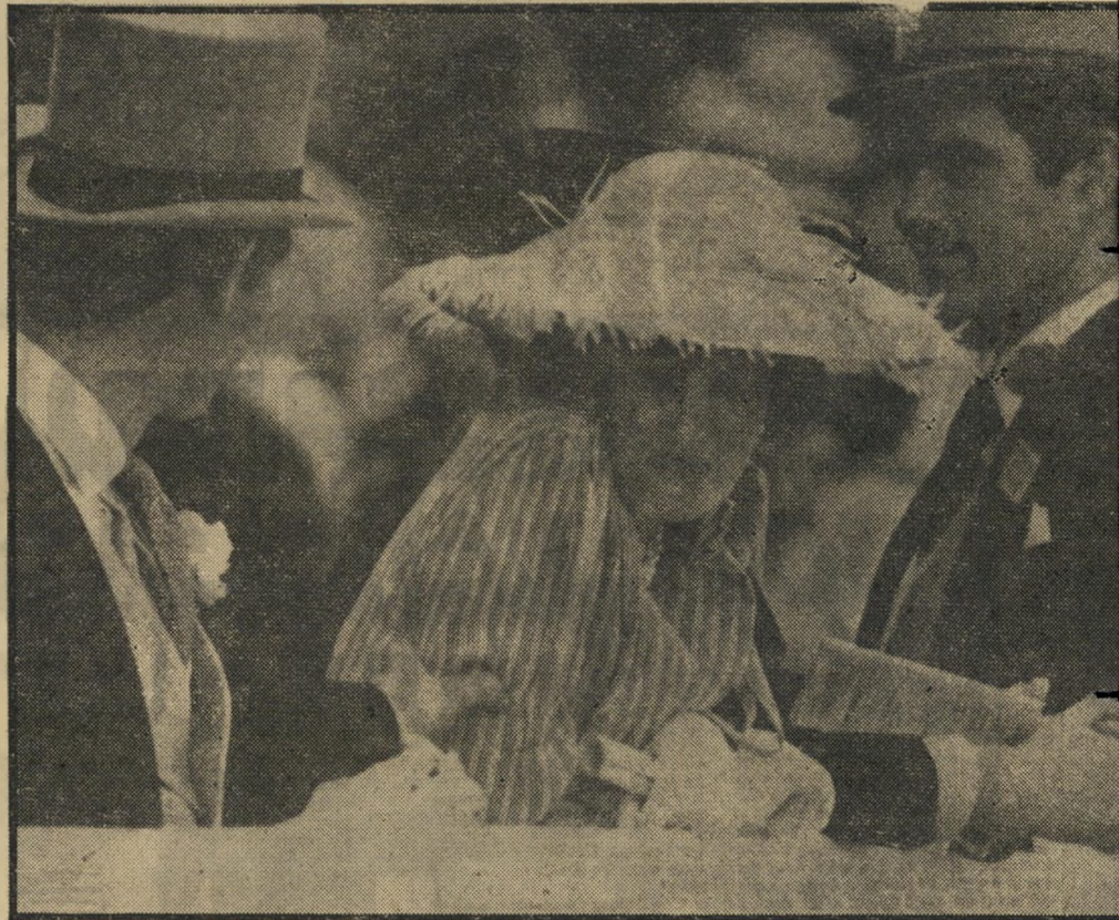
ליידי דיאנה ספנסר: הכלה בוכה לפני החתונה (בתמונה למעלה) ומנוחמת על ידי צ'ארלס וכלבו ברגע של פרטיות (בתמונה למטה)