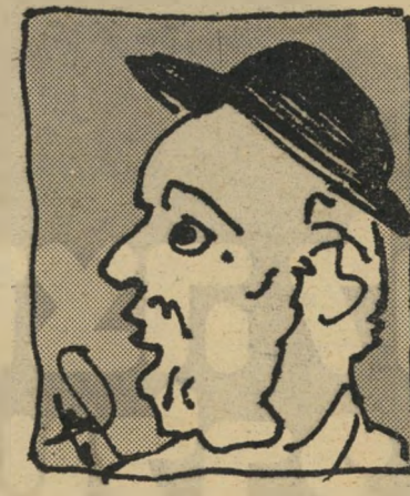
הרב זלמן בירוש

אין ספק: הברוך אמר את דברו. הוא העניק את עיקר כוחו לשני הגושים הגדולים - המערך והליכוד, ושלל את הייצוג מהמפלגות הדתיות הקיצוניות יותר. אך שוב, כרגיל, ביגלל שיטת הבחירות, אנו עדים לתופעה שמפלגה קטנה, המהווה את לשון-המאזניים, יכולה להשיג את כל מבין קשה, למרות שהיא מייצגת חלק קטן בעם. ואכן, המחד"ל נתנה אמש שיעור מאלף בתורת המו"מ הקואליציוני - מערך ולליכוד כאחד. אין זה סוד ש-הליכוד היה מוכן להעניק למחד"ל לא פחות משהעניק לו המערך, ולכן אין יסוד להתקפותיו של הרב אדלר על ה"הסכם. אם העדיפה המחד"ל את המערך, לא היה זה מסיבות חילוניות, אלא בגלל קירבה רעיונית למפלגה זו בעניינים מדיניים. נראה שצפויות לנו ולילדינו ארבע שנים קשות מבחינה דתית. הפסקת תיק